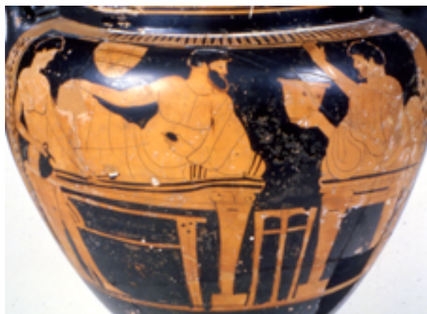
Fig. 1: kelèbe a figure rosse, produzione attica, con scena di banchetto, prima metà del V sec. a.C.

Durante i banchetti, in Grecia, i commensali si sdraiavano sulle loro klinai (i letti conviviali) davanti alle quali venivano approntate delle piccole tavole ( tràpezaí ): sopra di esse i servitori disponevano carni, formaggi e frutta secca (fig. 1); sotto queste tavole compaiono spesso degli animali, come i cani, presenti per raccogliere gli avanzi del pasto. In queste riunioni conviviali non veniva servito vino, che invece si beveva in grande quantità -mescolato in grossi vasi con acqua con una parte di vino e tre di acqua- durante il simposio (dal greco “bere insieme”), che seguiva il banchetto e poteva durare fino alle prime luci del mattino. Sia il banchetto che il simposio erano accompagnati da musica e balli e tra gli strumenti che venivano solitamente suonati possiamo vedere la cetra e il flauto; durante il simposio i commensali giocavano al kòttabos , gioco di società nel quale si doveva colpire, con un vaso potorio, dei piccoli recipienti messi in equilibrio precario su un’asta. Oppure cantavano, alternandosi,