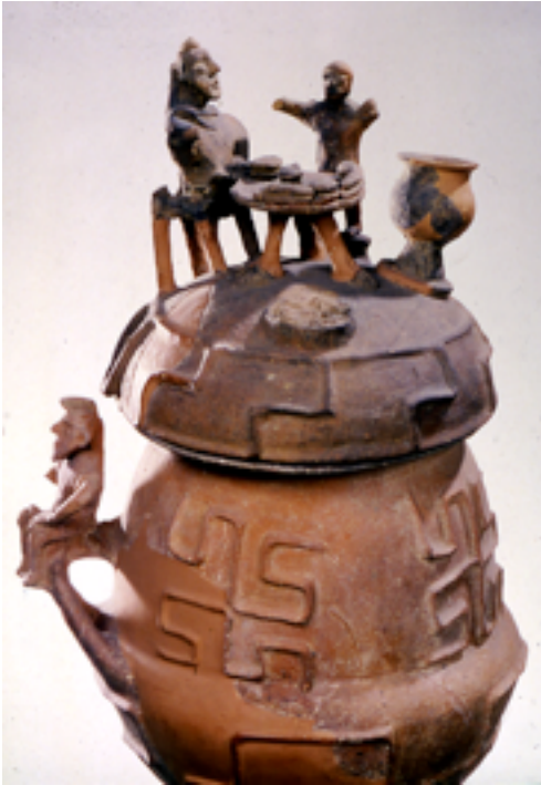
Fig. 3: cinerario di impasto con coperchio con decorazione plastica da Montescudaio (Volterra), metà del VII sec. a.C.

chetti, ai quali, i commensali, partecipano ognuno con un' etèra , cortigiana libera, dotata di una certa cultura. La donna greca passa la sua giornata all'interno del gineceo , nel quale si occupa di alcuni compiti, come lavorare al telaio, tessere stoffe, dirigere il lavoro delle ancelle, accogliere gli ospiti e di quanto altro fosse necessario per il buon andamento della casa.