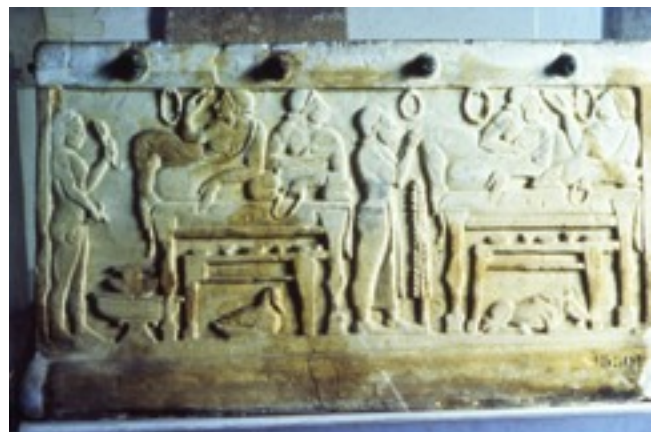
Fig. 4: urna in pietra fetida con scene di banchetto da Chiusi (Si), 520 a.C.