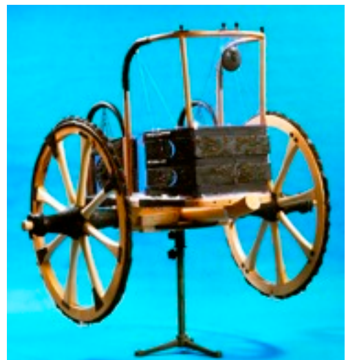
Fig. 4: carro da Populonia, Tomba dei Carri, seconda metà VII sec. a.C.