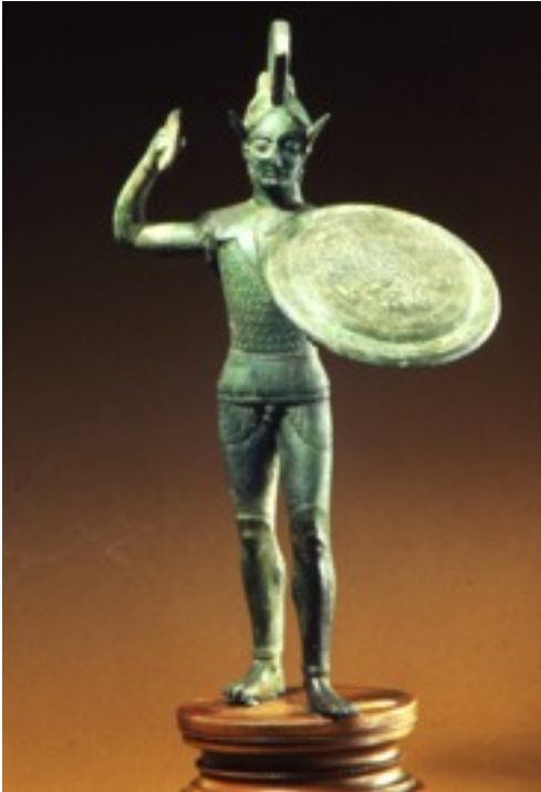
Fig. 3: bronzetto etrusco, Laran dio della guerra, inizi V sec. a.C.

lative a combattimenti e a campi di battaglia, si prediligono altre scene, come la preparazione del carro per partire in guerra, la vestizione dell'oplita che indossa gli schinieri, la partenza del soldato, che saluta la famiglia (rappresentata da un'anziana figura maschile, il padre, ossia la precedente generazione di cittadini-soldati) e da una figura femminile, la moglie o la madre, che lasciano partire il familiare per la guerra. Nelle immagini in cui compare il carro, generalmente c'è un auriga che, come si vede anche in un particolare del vaso François, indossa una lunga veste di colore bianco. Nelle scene di congedo possiamo trovare anche rappresentazioni relative a libagioni, in cui una figura femminile versa del vino in una phiale (coppa bassa senza anse e piede), tenuta in mano da un guerriero che ne lascia cadere qualche goccia per terra, facendo con la sinistra un gesto di preghiera; oppure momenti che precedono la guerra o la battaglia, come nelle scene di extispicio , ovvero una tecnica di esame delle interiora di un animale sacrificato (introdotta in Grecia nel VII sec. a.C. dall'Oriente), per conoscere l'esito della battaglia; infine, possiamo trovare scene legate a quella che i Greci chiamavano "la bella morte", cioè il ritorno a casa di un combattente caduto valorosamente, sorretto sulle spalle di un compagno. Tale motivo è rappresentato anche sulle anse del cratere François (fig. 2), dove Aiace porta sulle spalle il cugino