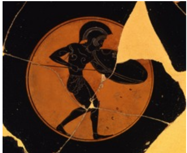
Fig. 1: kylix a occhioni, produzione attica, Epiktetos, 530-500 a.C.